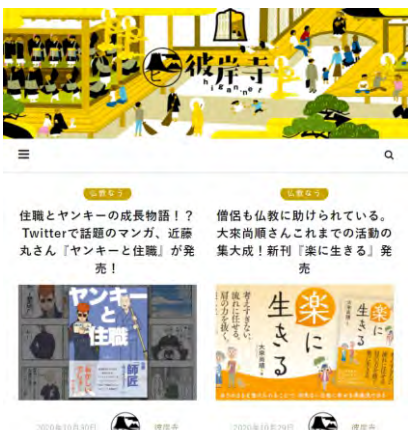
「インターネット寺院 彼岸寺」

仏教書籍も今の時代は手に入りやすくなっています。地元文苑堂さんなどでも本願寺出版社の本が並んでいますよ。一度探してみてくださいいね。